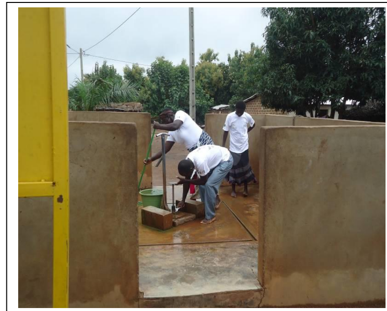
Photo 2 : Entretien du point d'eau

Les communautés bénéficiaires des projets, si l'on ne leur impose pas de solutions toutes faites, peuvent dans un esprit d'initiative, proposer des approches ou des stratégies plus efficaces et qui garantissent une meilleure pérennisation des ouvrages et la pérennisation de l'accès à l'eau potable en milieu rural.