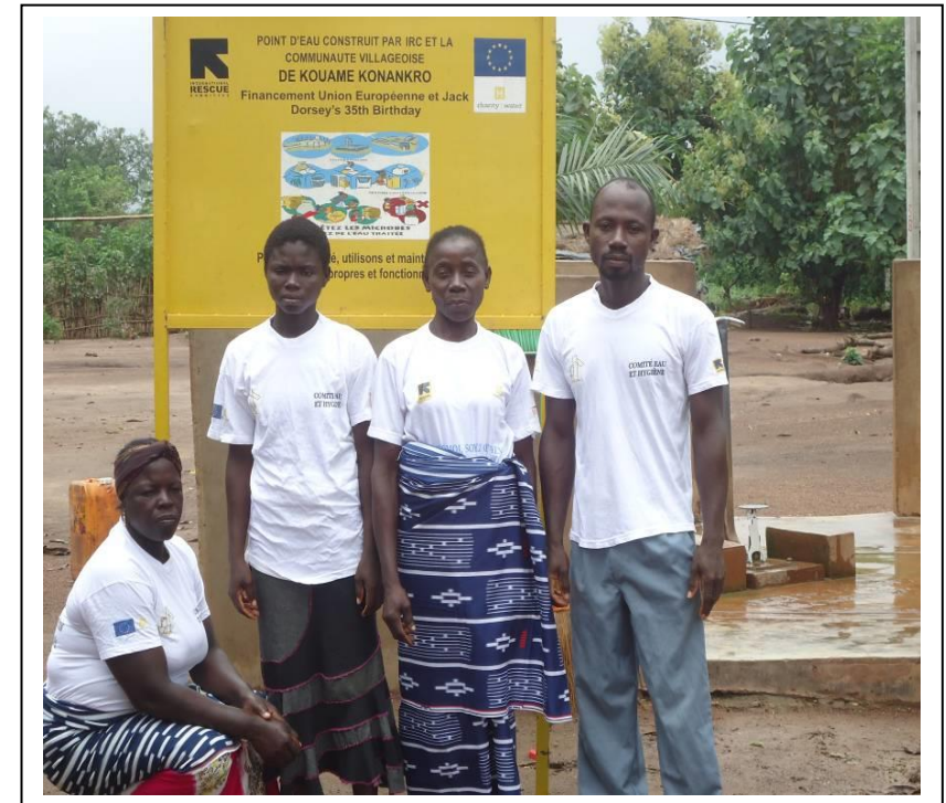
Photo1 : Quelques membres du Comité autour du point d'eau